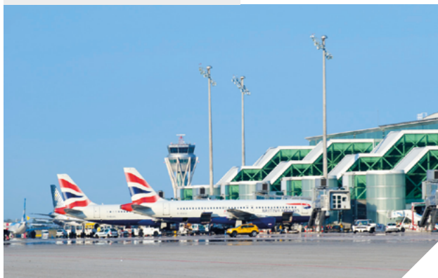
BCN Aeropuerto de Barcelona España