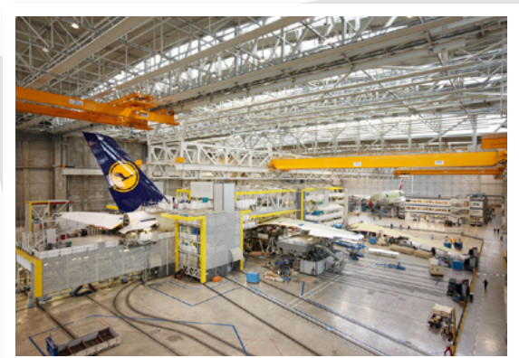
Airbus / A380 / Lufthansa Alemania