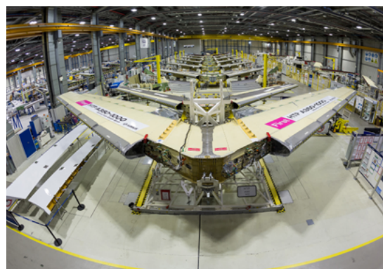
Airbus / A350-1000 Wings FTI

AERTEC dispone de una amplia experiencia como proveedor en el área de alas y cabina, desde la personalización a la instalación. Damos soluciones integrales cubriendo el ciclo completo del diseño del avión. Nuestros ingenieros diseñaron soluciones de cabina para el A350, y múltiples diseños de sistemas para el A380, incluyendo Singapore Airlines, Emirates, Qantas Airways, Korean Air, Deutsche Lufthansa, China Southern, Air Francia y Thai Airways.